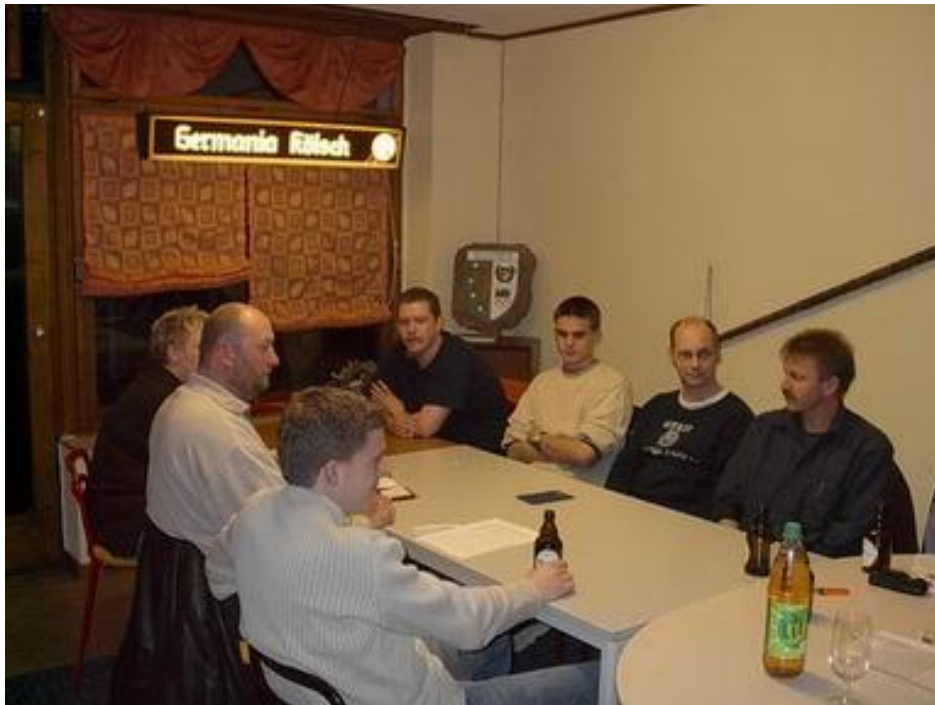
Fühlen sich in ihrem neuen Domizil recht wohl die Wissener Reservisten